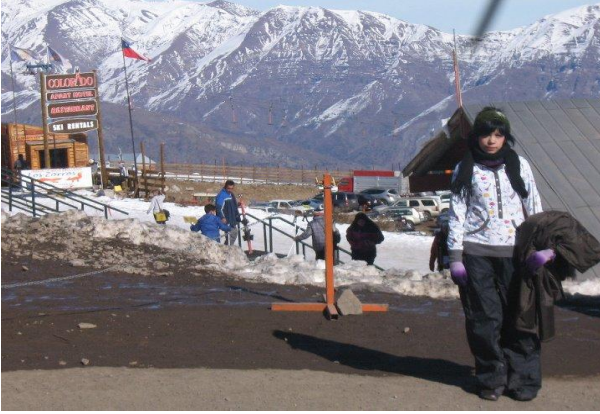
Centro de sky "El colorado"