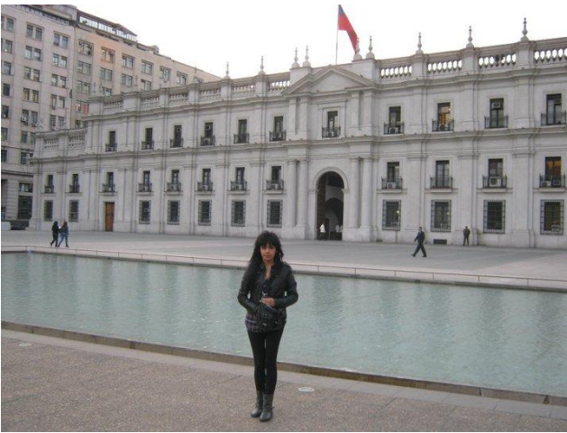
Palacio la Moneda. Santiago de Chile.